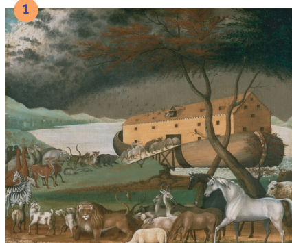
ציור: יואל וקסברגר, מלכות וקסברגר