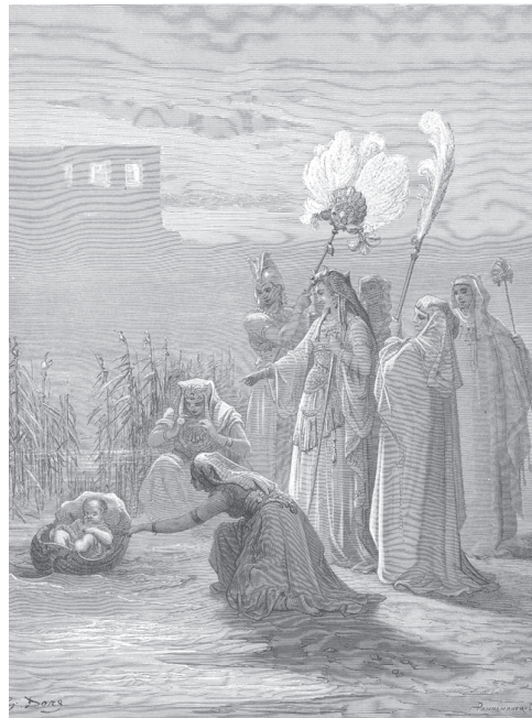
על האמן - פאול גוסטב דורה (בצרפתית: Paul Gustave Doré; 6 בינואר 1832 – 23 בינואר 1883) היה צייר ותחריטאי צרפתי שהתפרסם בציורי התנ"ך שלו